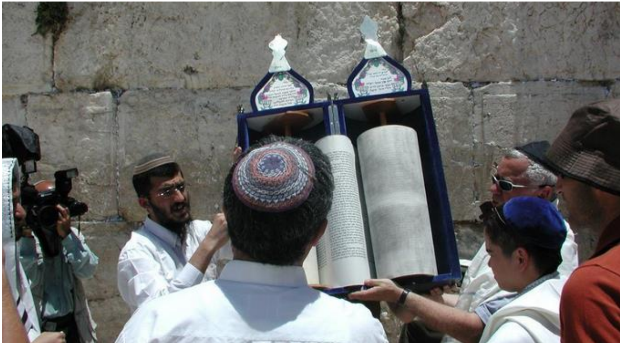
Bar Mitswa in Jeruzalem

Het is handig om te beginnen met het plannen van de route. Je kunt ervoor kiezen om het eerste deel van de vakantie met een huurauto door het land te reizen en afsluitend - na de auto ingeleverd te hebben - een aantal dagen in Jeruzalem door te brengen. Andersom kan natuurlijk ook.