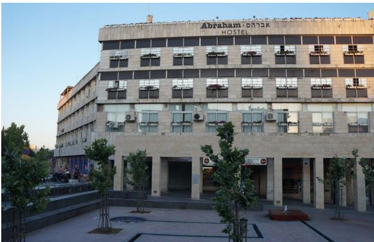
Abraham Hostel Jeruzalem

Er zijn veel verblijfsmogelijkheden in Israël zoals hotels, hostels, vakantiehuizen, appartementen, Air B&B adressen, kibboetsiem, enzovoort. Afhankelijk van het aantal personen, de duur van de reis en het budget kan de keuze anders uitvallen. Als je bijvoorbeeld gedurende meerdere dagen of weken met een gezin reist, is het fijn om wat privacy te hebben. In dat geval kan een Air B&B adres een handige keuze zijn, omdat je dan vaak een appartement met meerdere kamers kunt boeken. Let bij het bepalen van je verblijfadres op specifieke wensen en zet de 'must haves' en de 'nice to haves' op een rijtje. In de zomer is bijvoorbeeld een slaapkamer en/of woonkamer met airco min of meer een must. Ook de aanwezigheid van (gratis) wifi staat bij veel mensen hoog op het verlanglijstje. Let daarnaast op de locatie/licging van het verblijfadres. Bevindt deze zich langs een drukke weg, is er Openbaar Vervoer in de nabijheid, zijn er winkels waar ik wat boodschappen kan doen, enzovoort.