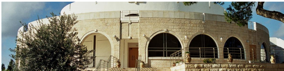
Messiaanse Gemeente Kehilat HaCarmel, Haifa

Het is bijzonder en ook aan te raden om tijdens je verblijf in Israël een kerkdienst te bezoeken. Bekend in Jeruzalem zijn de Protestantse Kerk Christ Church en King of Kings Community. Beide kerken hebben hun dienst op zondag. Verder zijn er door het hele land Messiaanse Gemeentes die op sabbat hun diensten hebben.