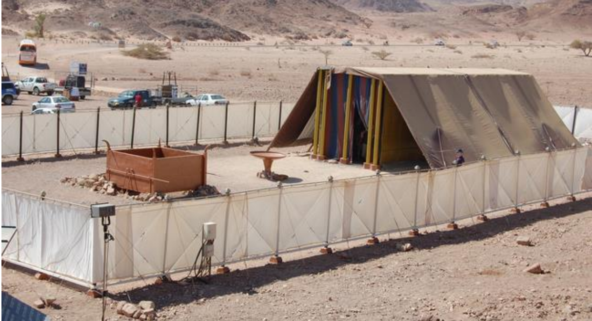
Replica van de tabernakel in Timna park

Een goede reisgids, ervaringen van anderen en de vele informatie op internet zullen je helpen om tot een mooie samenstelling van je reisprogramma te komen. En terwijl je daarmee bezig bent, leer je het land al een beetje kennen en begint de voorpret.